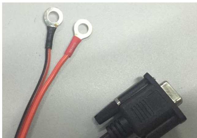
图 4 圆形端子和 DB9 接头

北斗终端和信息处理单元（如显控终端等）的连接接头，为了方便客户测试使用，默认发货的接头为 DB9 接头和电源圆形端子线，线长 5 米，规格书详见附件。如有特殊说明请和我司联系。