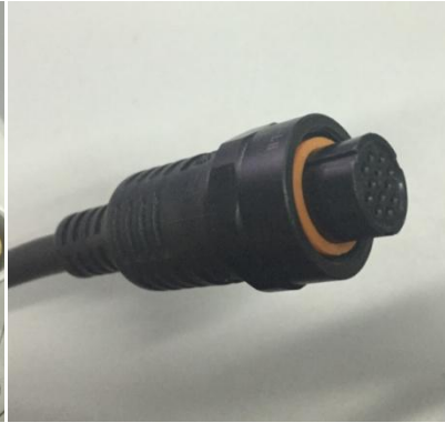
图 3 CK-1012F 插头